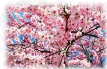
Ciliegi in fiore